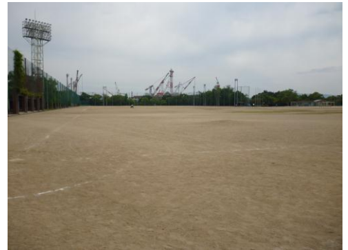
(市民広場 呉医療センター側写真)