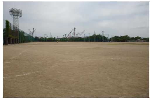
(市民広場 呉医療センター側写真)

◎校内への駐車には制限がありますので、できる限り乗り合わせて来てください。使用後の消灯・施錠は確実に行ってください。