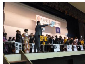
(中学校対抗クイズ大会時写真)

「平成25年中央地域成人式が行われました。とても活気あふれる催物となりました。呉市体育館駐車場には各地域によるいろいろな食事コーナーが用意されており、身も心も温まる成人式となりました。」