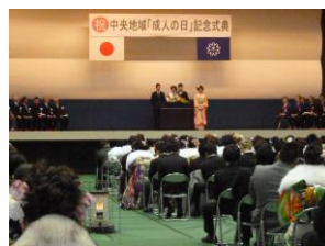
(はたちの誓い写真)