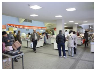
北海道展 くれの物産展