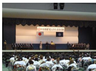
呉中央地区 成人式