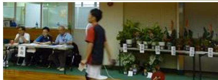
本部スタッフと賞品(鉢植え)の数々