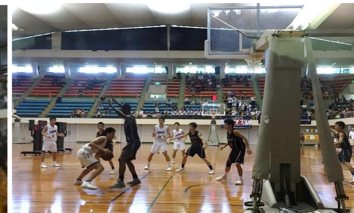
皆実対瀬戸内の試合