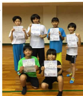
第10回中国・四国ブロック交流大会 入賞者