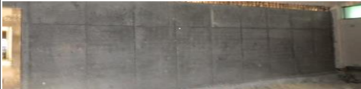
サブコート付近耐震補強工事（コンクリート打設・型枠取外し後）