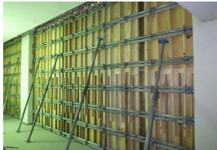
2階ロビー耐震補強工事（型枠建込み）