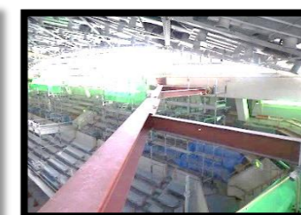
上部耐震補強も仕上げ段階