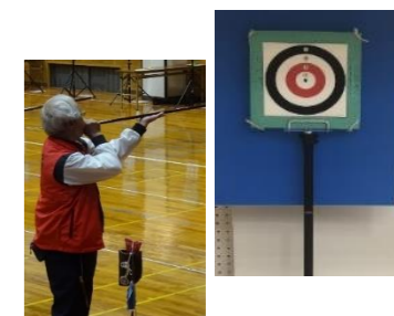
パーフェクトを達成した方々