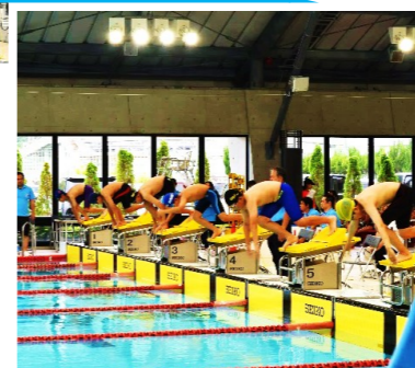
頑張った子たちを称えます

緊張しながらも、元気いっぱい選手宣誓から、熱い戦いの始まりです。子どもたちの賑やかな声援が響く中選手たちの頑張りを保護者さん・指導者さんたちがしっかりと見守り応援をされていました。