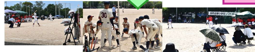
呉市女性卓球大会