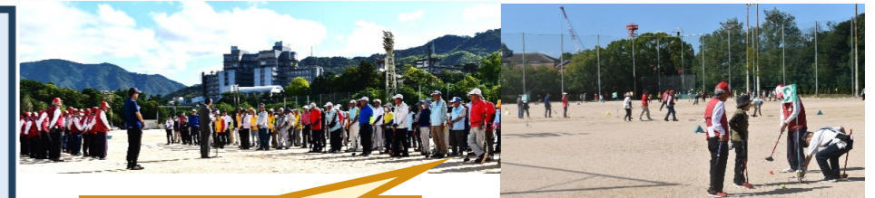
呉市グラウンドゴルフ大会