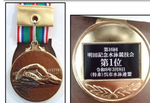
受賞した金メダル

3月8日(日)シンヨーアクアパークで催された 呉市水泳連盟主催「第16回明田記念水泳競 技会」にて、水泳教室受講生が、2部門で